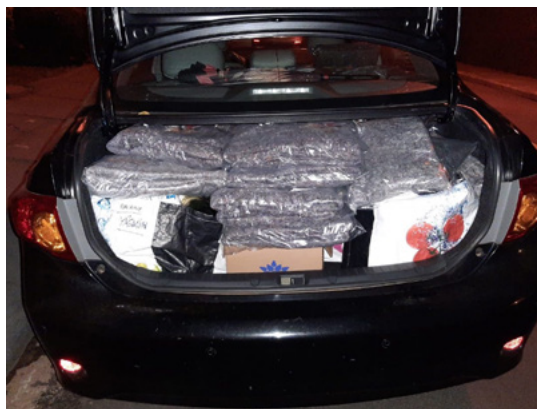
Prontos para entrega junto com as cestas.