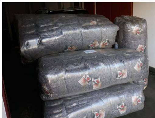
Cobertores adquiridos pela SEOB

Com tantas mudanças ocorrendo no mundo, em especial agora, em decorrência do isolamento social, o acesso aos conteúdos digitais cresceu drasticamente. Nossas redes sociais – Facebook e Instagram – têm sido atualizadas com mais frequência, tudo para informar e não deixar desamparados os frequentadores de nossa casa, enquanto as atividades presenciais estão suspensas. Contudo, com a redução das atividades presenciais, também se reduziram as notícias e esse é um dos motivos pelos quais o Correio do Bem passa a ser bimestral a partir de agora. Será assim para sempre? Não sabemos dizer, por ora. Mas a todo momento é possível ter acesso às decisões da casa em nossas redes sociais e no site. Aqui no jornal, serão registradas com mais detalhes e de modo mais aprofundado as notícias mais importantes da SEOB.